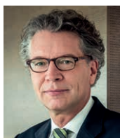
Stephan Müller Oppenhoff & Partner